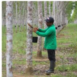
Natural Rubber | Colombia