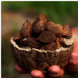
REDD + CASTAÑEROS | PERÚ